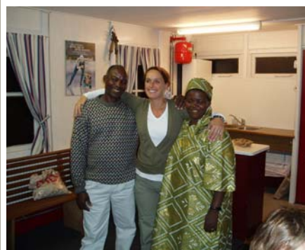
Ontmoeting sponsoren in de kantine van de ijsbaan.